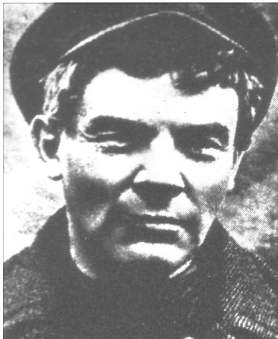
Lénine en juillet 1917, quand, caché en Finlande à cause d'un mandat d'arrestation lancé par le gouvernement de coalition, il rédige L'État et la révolution