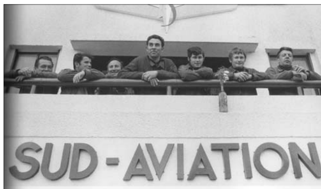
La primera fábrica ocupada en mayo de 1968 fue Sud-Aviation (después Airbus) en Nantes, donde los militantes de la Organisation Communiste Internationaliste (miembro del Comité internacional de la 4ª Internacional) eran activos.

Estas primera indicaciones son suficientes para mostrar que las oscilaciones oportunistas de la política del grupo a que el PCI fue reducido entre 1952 y 1968 (aunque en 1966 fuera proclamada la OCI, continuaba siendo un grupo) han sido a menudo muy fuertes e importantes. De todas formas, ninguna organiza-