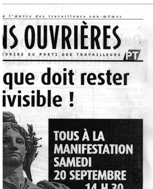
0 de septiembre de 2003

nario guardar silencio sobre la de Mitterrand.